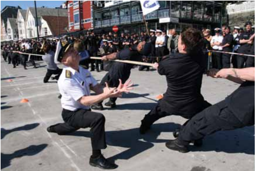
Dragkamp om lokal lønn!

Lokale forhandlinger og lønnspolitikk er en viktig del av god personalforvaltning. Selv når virksomhetene har begrenset økonomisk handlingsrom i lokale forhandlinger, må den helhetlige personalpolitikken sikre at de ansatte får tilbakemelding om jobbutførelse. Det kan være andre forhold som motiverer til innsats, slik som mulighet til kompetanseutvikling og nye arbeidsoppgaver.